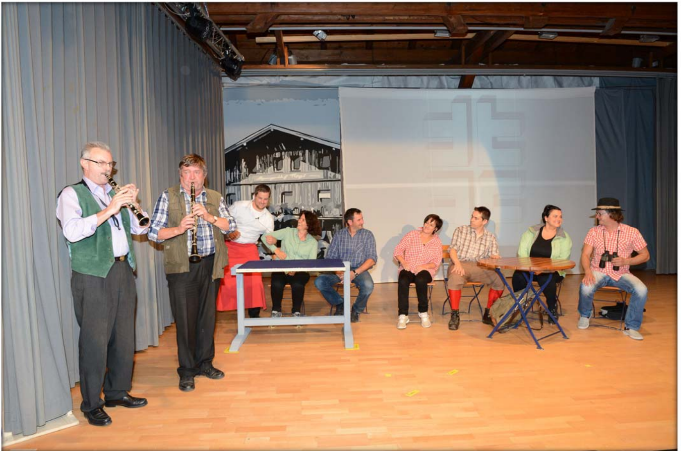
2013 19.10./25.10./26.10. 2013 «Dr scheeni Fahnä»